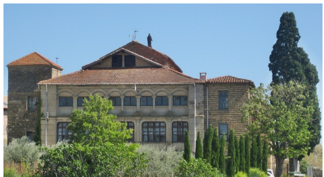
Palacio de los Condes de Ezpeleta, actual albergue del Centro de Turismo Rural de Beire

La artista que realizó el dibujo es Cécile-Alice WINTER-SCHAHL (Estrasburgo, 1863-Dijon, 1943). De esta autora alsaciana no hemos podido obtener demasiados datos. Conocemos su dedicación por el dibujo, por el pastel y la acuarela, mostrando gran interés por el retrato y las figuras. Resulta evidente que realizó un viaje por Navarra, a principios del siglo XX, como demuestra este dibujo.