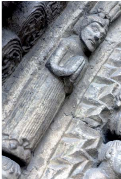
Portada de la iglesia de Santa María la Real de Sangüesa. Detalle.