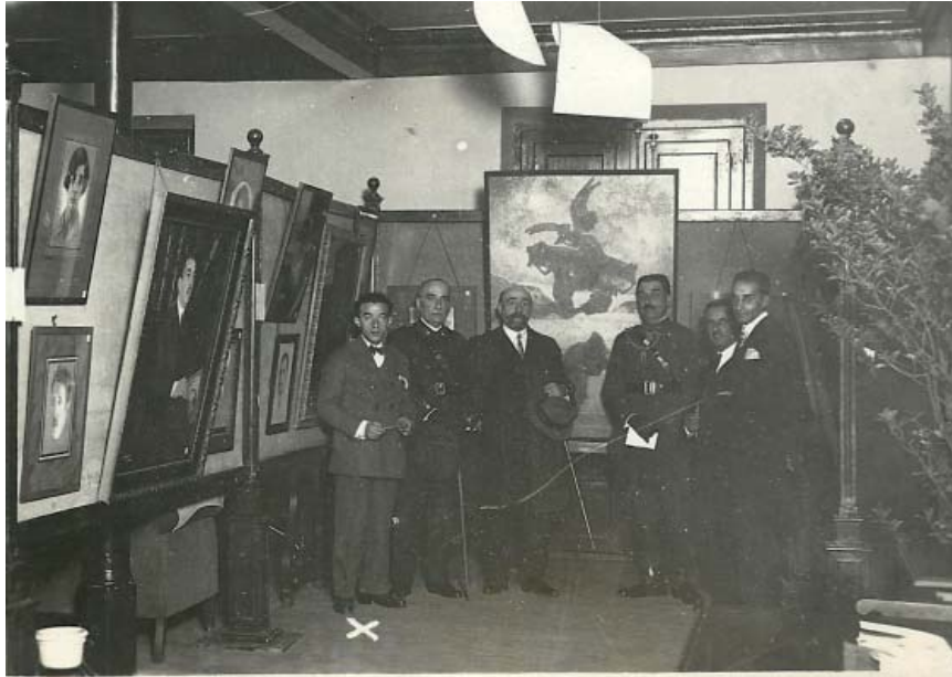
Crispín en la exposición en el Ateneo de Logroño, en 1927

zábal, 2016). En dicho artículo analizamos los paisajes del artista además de incluir un periplo biográfico del mismo, motivo por el cual omitimos este apartado ahora.