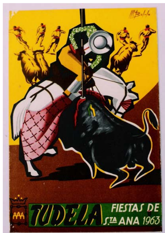
Cartel anunciador de las Fiestas de Sta. Ana de Tudela (1963).