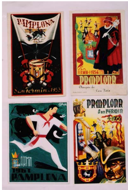
Diversos carteles referentes a las Fiestas de San Fermín.