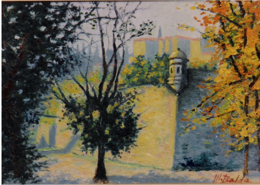
“Murallas de Pamplona”. Oleo/tabla. 18 x 25 cms. Col. Particular (Pamplona). 1997.