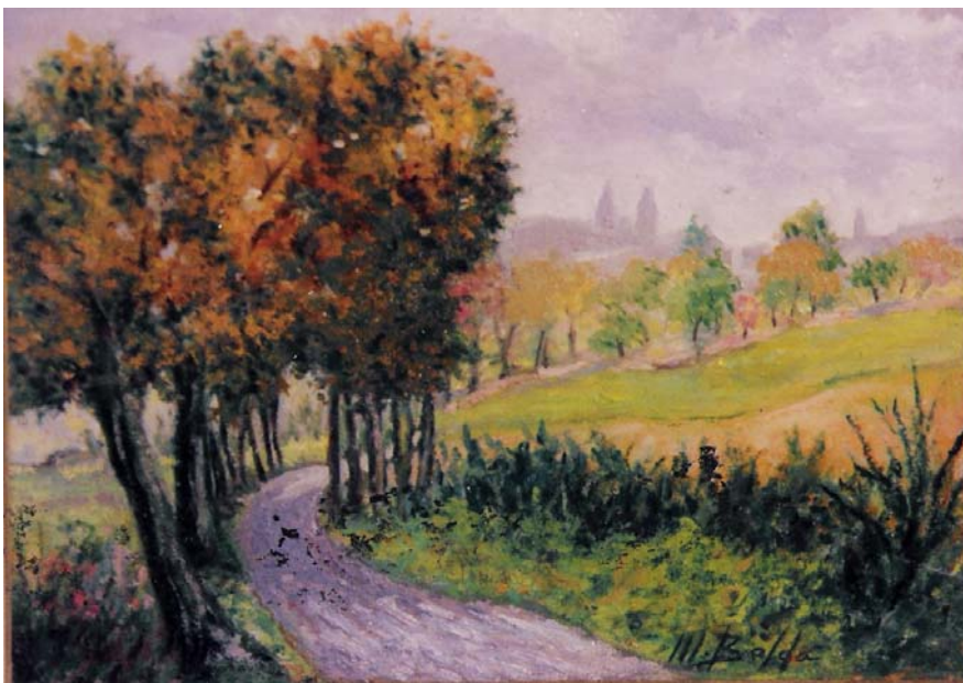
“Desde la Magdalena”. Oleo/tabla. 18 x 25 cms. Col. Particular (Pamplona). 1996.