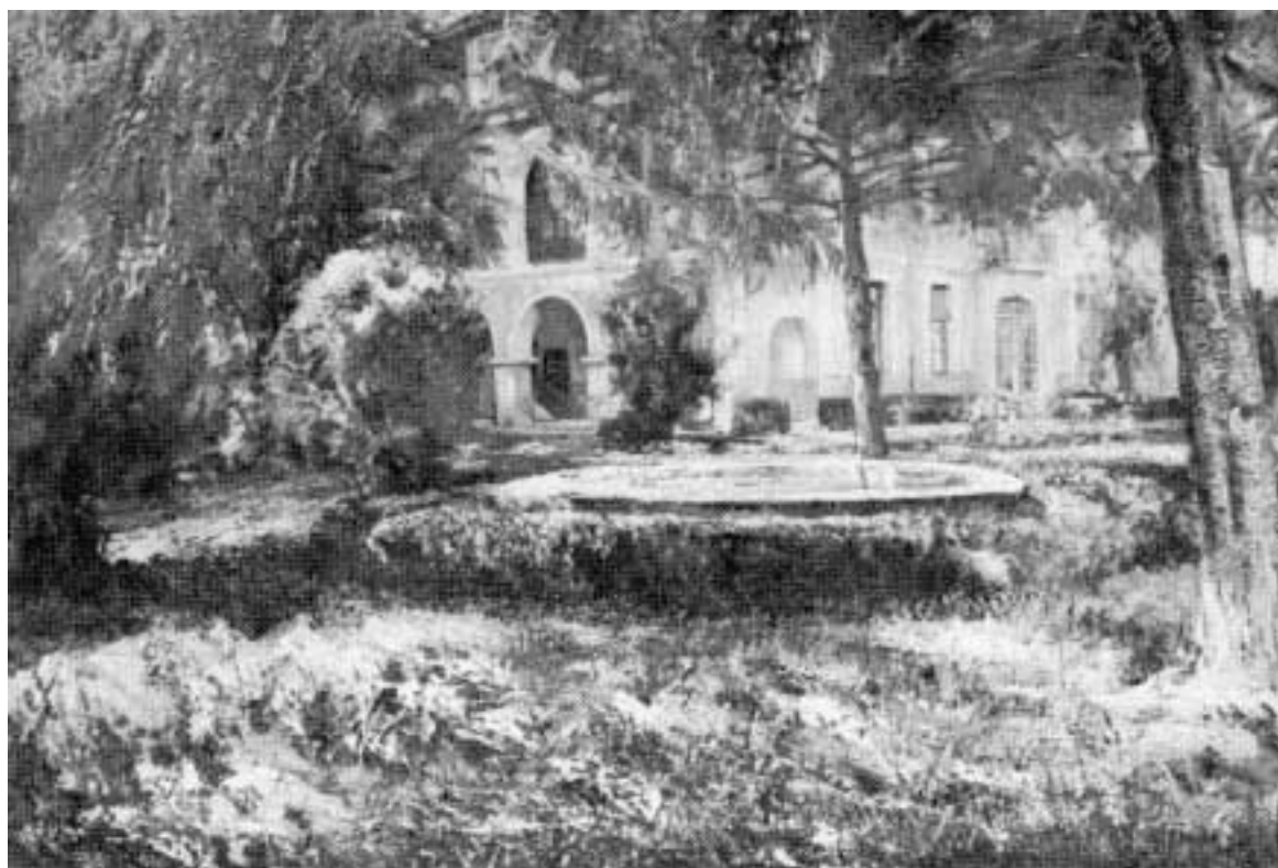
«Huerta de Irujo» (1944)