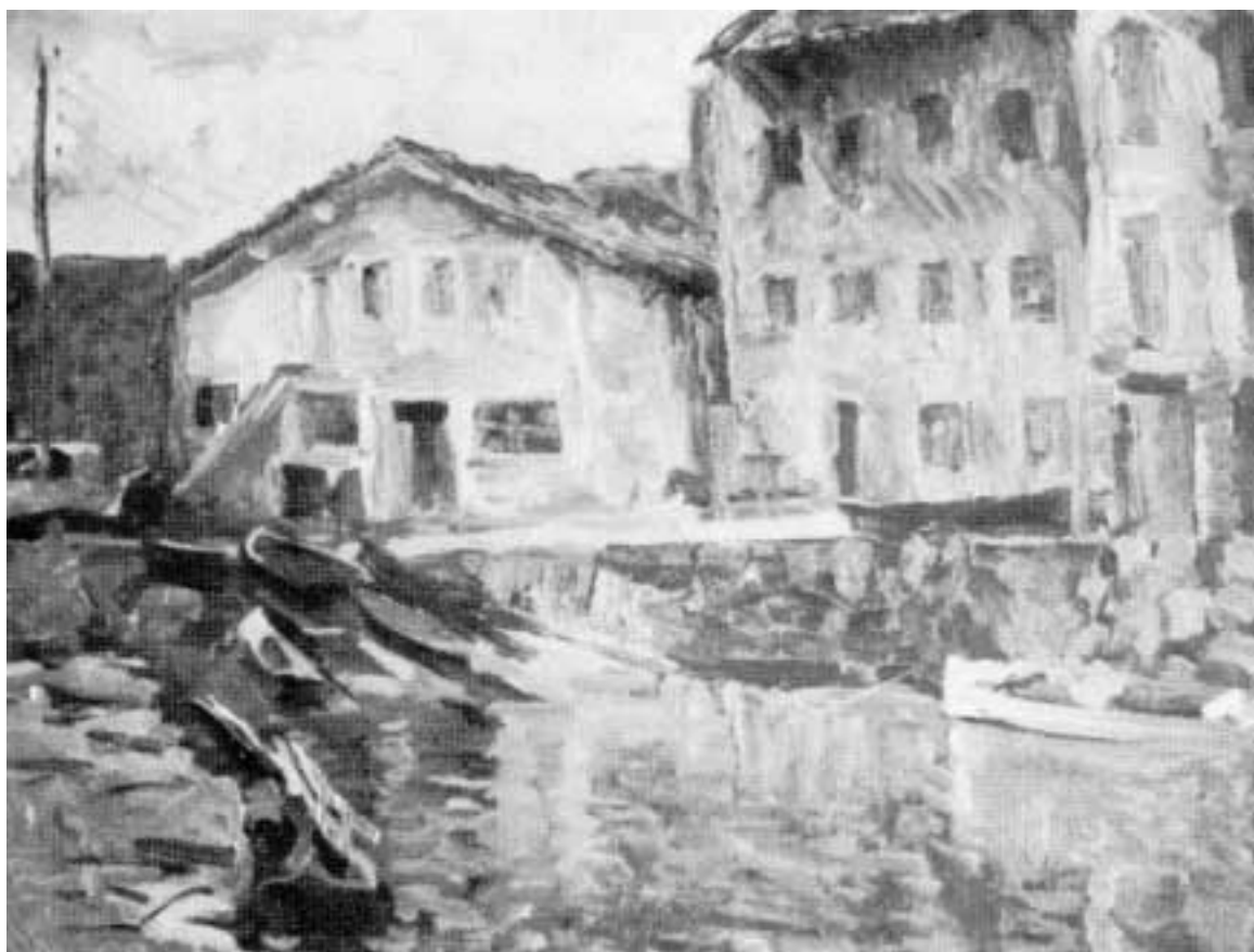
«Puerto Vasco» (1945-50)