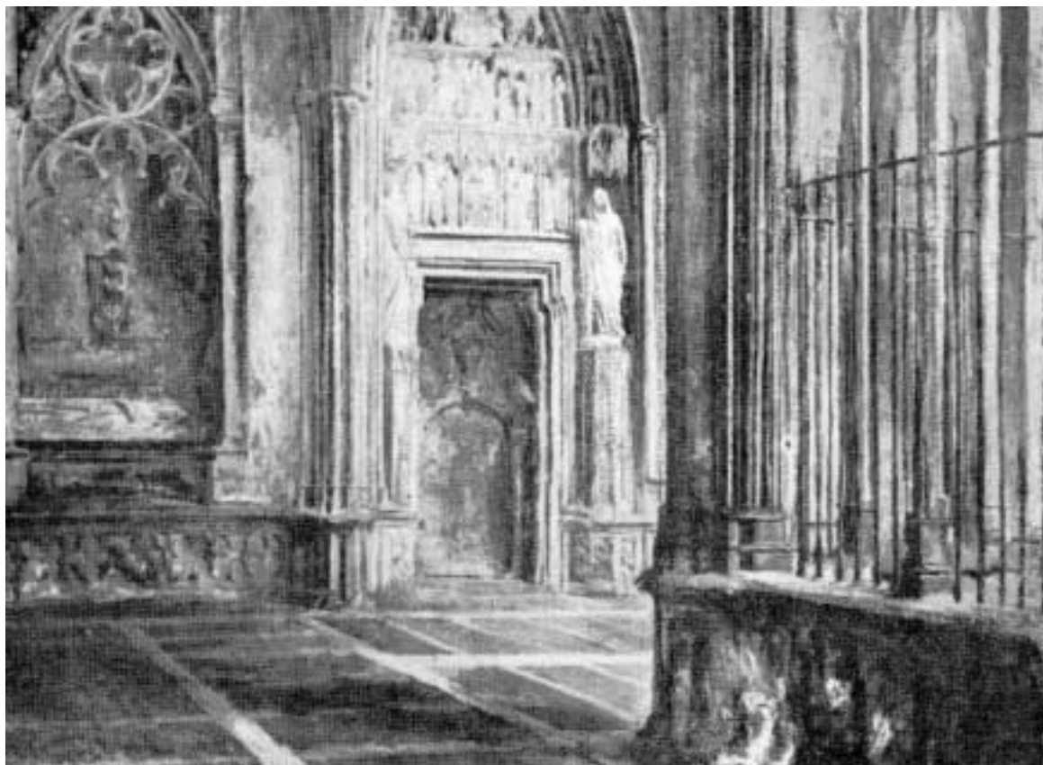
«La Preciosa» (1928).