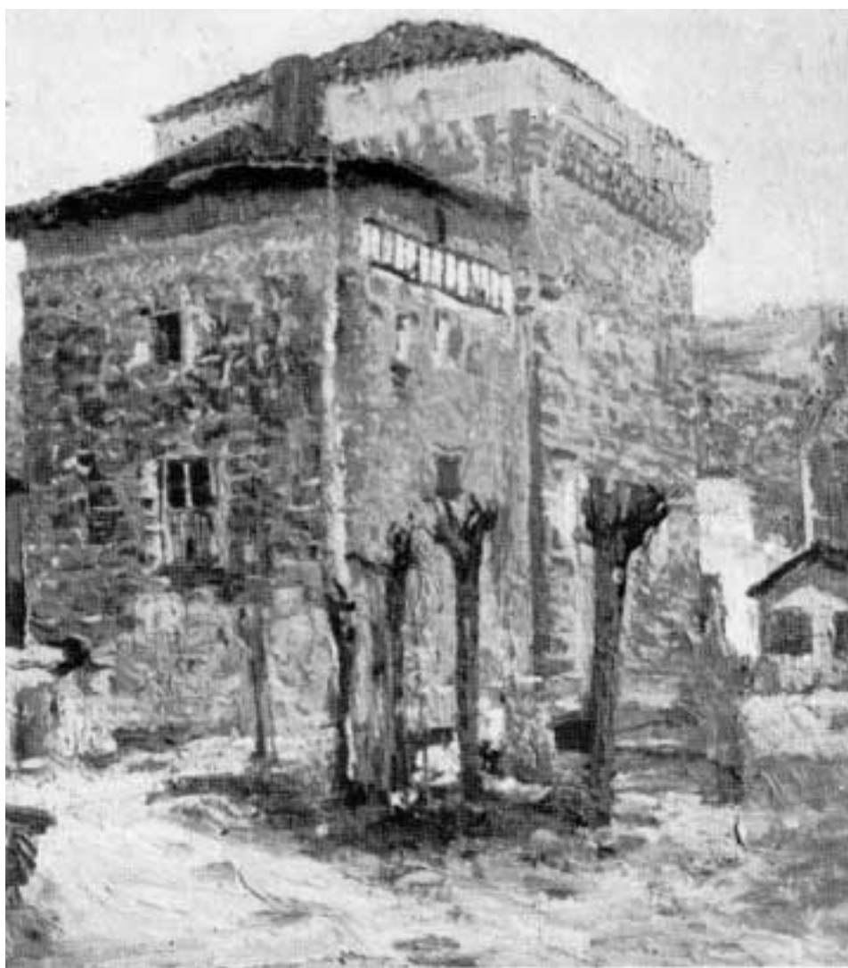
«Torre de Lesaca» (1920)