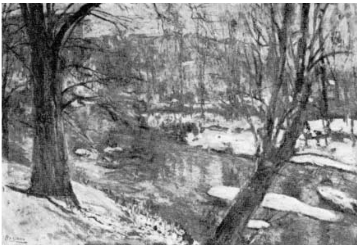
«El Arga con nieve» (1943)