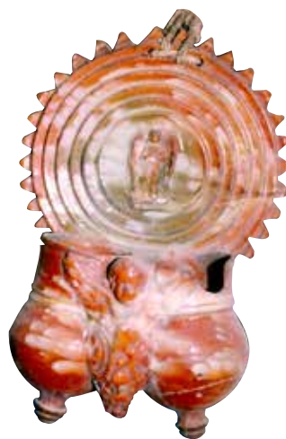
Figura 12. Cucharero número 7.

El frontis, que no acaba en picos sino que es liso, se compone de una especie de círculos concéntricos. En el centro de los mismos lleva una