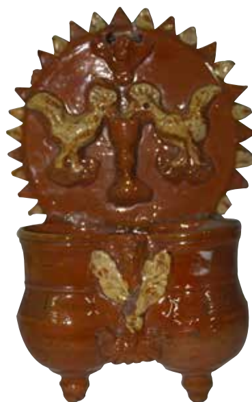
Figura 6. Cucharero número 1.

El frontis, acabado en picos, está compuesto por la escena –por lo visto muy típica en este alfar– de la pareja de aves bebiendo de un cáliz central. En el centro superior lleva una decoración compuesta por un pequeño angelote de alas abiertas. Los pocillos son dos recipientes cilíndricos y verticales unidos por los bordes, ligeramente abultados en la parte inferior y de-