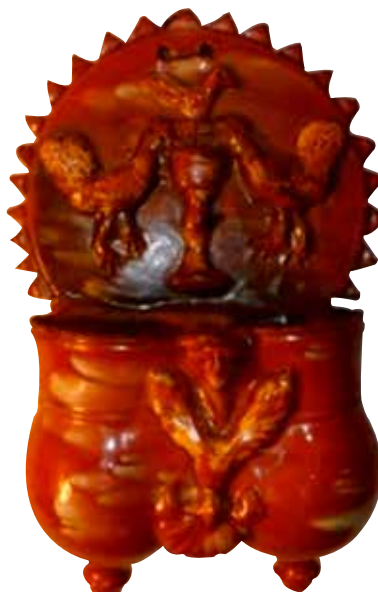
Figura 24. Cucharero número 19.

El frontis, acabado en picos, está compuesto por una escena, característica en este alfar, de la pareja de aves bebiendo de un cáliz central. En el centro superior lleva una decoración compuesta por un pájaro. Los pocillos son dos recipientes cilíndricos y verticales unidos por los bordes, ligeramente abultados en la parte inferior, decorados por una máscara entre motivo vegetal y una concha debajo de esto. El vedrío de la pieza es en tonos rojizos y verdosos, con toques. Resulta una pieza elegante y perfectamente trabajada.