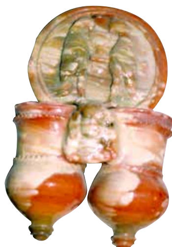
Figura 13. Cucharero número 8.

El frontis, que no acaba en picos, está compuesto por una escena, muy característica en este alfar, de dos aves bebiendo de un copa central. En este caso, los pájaros son de mayor tamaño que en ejemplos anteriores y se colocan en posición vertical y frontal. Los pocillos son dos recipientes cilíndricos y verticales unidos por los bordes, ligeramente abultados en la parte inferior, decorados por una máscara entre ellos. El vedrío de la pieza es en tonos rojizos, verdosos y blanquecinos.