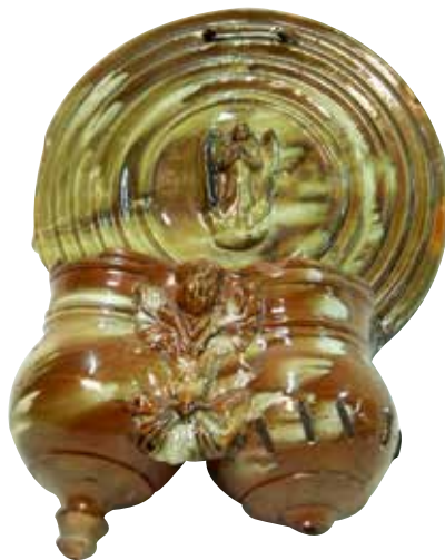
Figura 7. Cucharero número 2.

El frontis, que no acaba en picos sino que es liso, se compone de una especie de círculos concéntricos. En el centro de los mismos lleva una sencilla decoración compuesta por un ángel en pie. Los pocillos son dos recipientes cilíndricos y verticales unidos por los bordes, ligeramente abultados en la parte inferior, decorados por una cabeza de angelote entre motivo vegetal. Al pocillo de la derecha le falta el pitorro inferior y está unido por un grapado que parece antiguo. El vedrío de la pieza es en tonos ocres y amarillentos, y resulta atractivo. Estamos ante una pieza digna y decorativa.