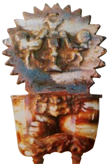
Figura 21. Cucharero número 16.

El frontis, acabado en picos, lleva en la parte central la típica composición de dos aves bebiendo, con una figura de pájaro encima. Los pocillos son dos recipientes cilíndricos y verticales unidos por los bordes, decorados con un motivo vegetal entre ellos. El vedrío de la pieza está elaborado en tonos rojizos y ocre. Tampoco parece una de las piezas más conseguidas de este alfar.