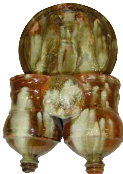
Figura 25. Cucharero número 20.

El frontis, que no acaba en picos sino que es liso, está compuesto por la escena, muy característica en este alfar, de una pareja de aves bebiendo de un cáliz central. En este caso, los pájaros son de mayor tamaño que en ejemplos anteriores y se colocan en posición vertical. Los pocillos son dos recipientes cilíndricos y verticales unidos por los bordes, ligeramente abultados en la parte inferior, decorados por un motivo floral circular. El vedrío de la pieza es en tonos rojizos, y verdosos, con abundantes toques estanníferos. Este vedriado resulta enormemente atractivo y policromo.