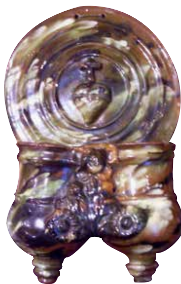
Figura 26. Cucharero número 21.

El frontis, que no acaba en picos sino que es liso, se compone de una especie de círculos concéntricos. En el centro de los mismos lleva una por un corazón con cruz encima, símbolo claramente religioso. Los pocillos son dos recipientes cilíndricos y verticales unidos por los bordes, ligeramente abultados en la parte inferior, decorados entre ellos por un gran motivo vegetal. El vedrío de la pieza es policromo, y resulta enormemente atractivo. Estamos ante una pieza elegante y bien conseguida.