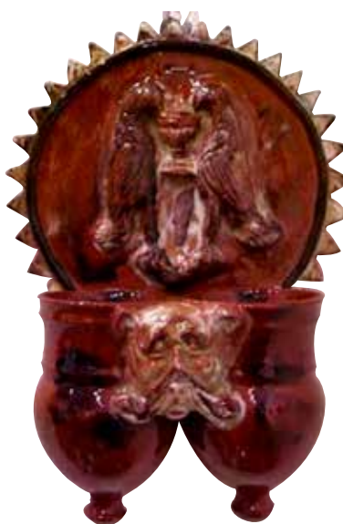
Figura 28. Cucharero número 23.

El frontis, que no acaba en picos sino que es liso, está compuesto por la escena, muy típica en este alfar, de una pareja de aves bebiendo de un cáliz central. En este caso, los pájaros son de mayor tamaño que en ejemplos anteriores y se colocan en posición vertical. Los pocillos son dos recipientes cilíndricos y verticales unidos por los bordes, ligeramente abultados en la parte inferior, decorados por un motivo floral circular. El vedrío de la pieza es en tonos ocre y rojizos. No parece tratarse de una de las piezas más conseguidas de este alfar.