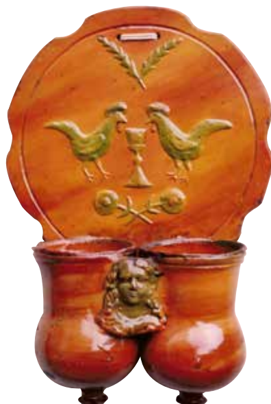
Figura 17. Cucharero número 12.

El frente, de borde liso y ondulado, está decorado en el centro con dos aves que beben de un cáliz, motivo claramente religioso, con una palma entrecruzada encima y unas flores debajo. Según tenemos entendido, buena parte del frente sufrió una restauración más o menos importante. La parte inferior lleva dos recipientes que se van ensanchando hacia el fondo. El frente de estos recipientes está decorado con el busto de una figura femenina. El vidriado de la pieza, bastante uniforme, va en rojizos y amarillentos.