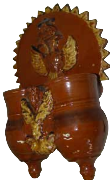
Figura 9. Cucharero número 4.

El frontis, acabado en picos, lleva en la parte central una composición con un águila bicéfala, de alas abiertas y coronada. Recuerda mucho al escudo imperial de Carlos I. El estudio de M. a Luisa García reproduce el molde de esta decoración (García, 1984a, lám. X, fig. 5). Los pocillos son dos recipientes cilíndricos y verticales unidos por los bordes, con abultamiento en la parte inferior y decorados con una cabeza de angelote entre un motivo vegetal. El vidrio de la pieza, elaborado en tonos ocres y rojizos, con engalba, recuerda bastante al cucharero número 1 de nuestro catálogo. Resulta una pieza elegante, bien construida.