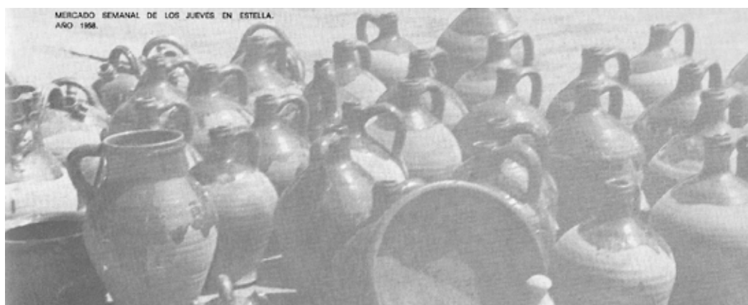
Figura 2. Venta de alfarería en Estella, mercado de los jueves en la plaza. Años cuarenta-cinuenta.