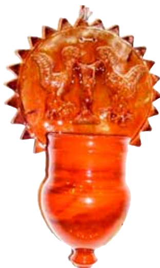
Figura 31. Cucharero número 26.

El frontis, acabado en picos, lleva en la parte central la composición de un par de aves enfrentadas y bebiendo de un cáliz. El pocillo es un recipiente vertical que no lleva decoración alguna. El vedrío de la pieza está elaborado en tonos rojizos. Igual que el ejemplar anterior, resulta una pieza mucho más simple que la mayoría de las piezas catalogadas.