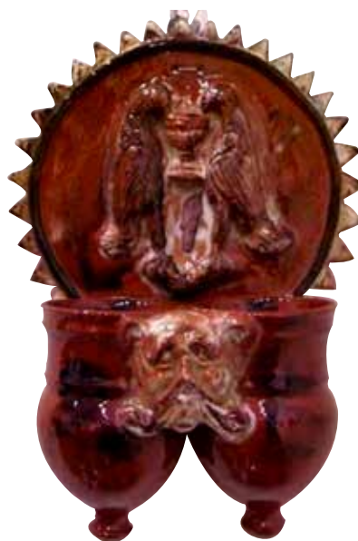
Figura 29. Cucharero número 24.

El frontis, que no acaba en picos sino que es liso, está compuesto por la escena, tan repetida en este alfar, de una pareja de aves bebiendo de un cáliz central. En este caso, los pájaros son de mayor tamaño que en ejemplos anteriores y se colocan en posición vertical. Los pocillos son dos recipientes cilíndricos y verticales unidos por los bordes, ligeramente abultados en la parte inferior, decorados con una gran máscara. El vidrio de la pieza es en tonos ocres y rojizos.