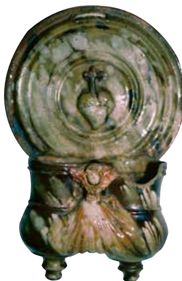
Figura 27. Cucharero número 22.

El frontis, que no acaba en picos, se compone de una especie de círculos concéntricos. En el centro de los mismos lleva la decoración de un corazón con una cruz encima, símbolo claramente religioso. Los pocillos son dos recipientes cilíndricos y verticales unidos por los bordes, ligeramente abultados en la parte inferior, decorados entre ellos por un angelote de alas abiertas y una concha debajo de este. El vedrío de la pieza es verdoso con partes estanníferas; resulta muy vistoso y decorativo.