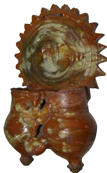
Figura 10. Cucharero número 5.

El frontis, acabado en picos, se compone de una serie de círculos concéntricos, muy semejante al cucharero n.º 2. Lleva en la parte central una composición decorativa con un ángel. Los pocillos son dos recipientes cilíndricos y verticales unidos por los bordes, con abultamiento en la parte inferior y decorados con una cabeza de angelote entre un motivo vegetal y una concha. El vidrio es entre rojizo y melado, con manchas de engalba y estanníferas. Resulta un cucharero bonito y decorativo.