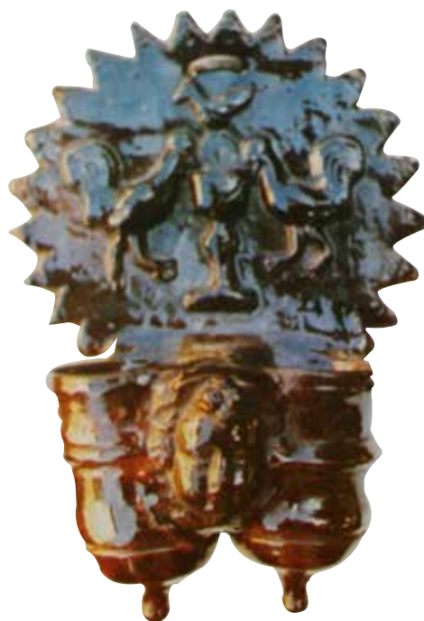
Figura 22. Cucharero número 17.