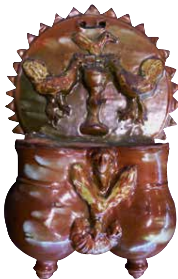
Figura 15. Cucharero número 10.

El frontis, acabado en picos, está compuesto por una escena, característica en este alfar, de la pareja de aves bebiendo de un cáliz central. En el centro superior lleva una decoración compuesta por un pájaro. Los pocillos son dos recipientes cilíndricos y verticales unidos por los bordes, ligeramente abultados en la parte inferior, decorados por una máscara entre motivo vegetal y una concha debajo de esto. El vedrío de la pieza es en tonos rojizos y verdosos, con toques estanníferos y resalta con engalba los pájaros y el motivo vegetal. Resulta una pieza elegante, bien construida.