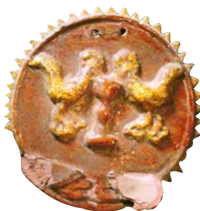
Figura 14. Cucharero número 9.

El frontis, acabado en picos, está compuesto por una escena, muy característica en este alfar, de una pareja de aves bebiendo de un cáliz central. El vedrío de la pieza se realiza en tonos rojizos, resaltando con engalba los pájaros. Los pocillos se han perdido. Por lo conservado no da sensación de que fuera un cucharero de gran calidad.