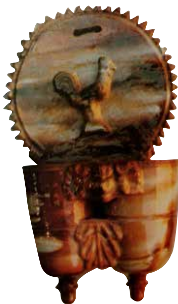
Figura 23. Cucharero número 18.

El frontis, acabado en picos, lleva en la parte central la composición de una solitaria ave. Los pocillos son dos recipientes cilíndricos y verticales unidos por los bordes, decorados con una máscara y un motivo vegetal entre ellos. El vedrío de la pieza está elaborado en tonos rojizos y ocreos y verdosos, con toques estanníferos. Al igual que sucede con los cuchareros anteriores, no parece ser una de las piezas más conseguidas de este alfar.