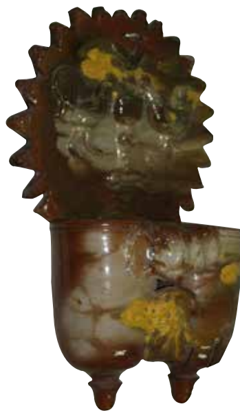
Figura 8. Cucharero número 3.

El frontis, acabado en picos, lleva en la parte central la típica composición de dos pájaros bebiendo del cáliz, con un angelote encima de ellos. Los pocillos son dos recipientes cilíndricos y verticales unidos por los bordes, decorados con un motivo vegetal entre ellos. El pocillo de la parte derecha está unido por un grapado que parece antiguo. El vedrío de la pieza está elaborado en tonos ocres oscuros, blanquecinos y amarillentos.