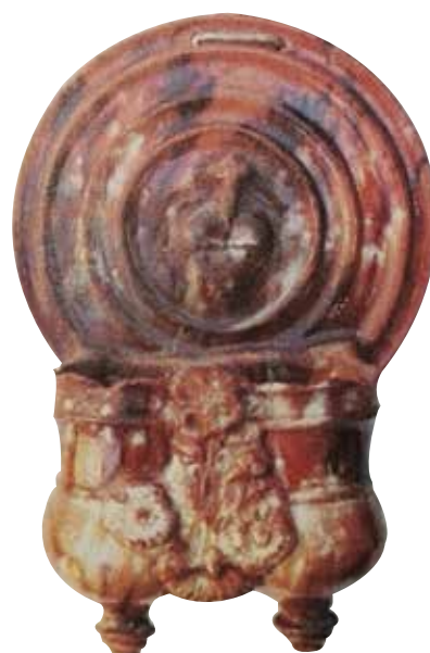
Figura 20. Cucharero número 15.

El frontis, que no acaba en picos sino que es liso, se compone de una especie de círculos concéntricos. En el centro de los mismos lleva una decoración compuesta por un corazón con cruz encima, símbolo claramente religioso. Los pocillos son dos recipientes cilíndricos y verticales unidos por los bordes, ligeramente abultados en la parte inferior, decorados entre ellos por un gran motivo vegetal. El vidrio de la pieza es en tonos ocre, rojizos y amarillentos, y resulta atractivo. Estamos ante una pieza elegante y decorativa.