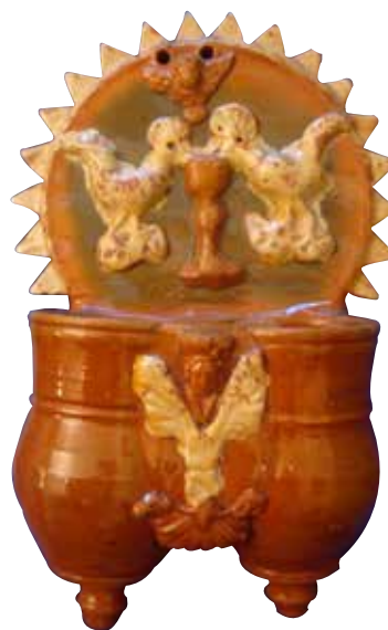
Figura 16. Cucharero número 11.

El frontis, acabado en picos, está compuesto por una escena, tan típica en este alfar, de la pareja de aves bebiendo de un cáliz central. En el parte superior lleva una decoración compuesta de angelote con alas abiertas. Los pocillos son dos recipientes cilíndricos y verticales unidos por los bordes, ligeramente abultados en la parte inferior, decorados por una máscara entre motivo vegetal y una concha debajo de esto. El vedrío de la pieza es en tonos rojizos y verdosos, resalta con engalba los pájaros, el motivo vegetal y los picos exteriores. Resulta una pieza elegante, de colorido muy atractivo.