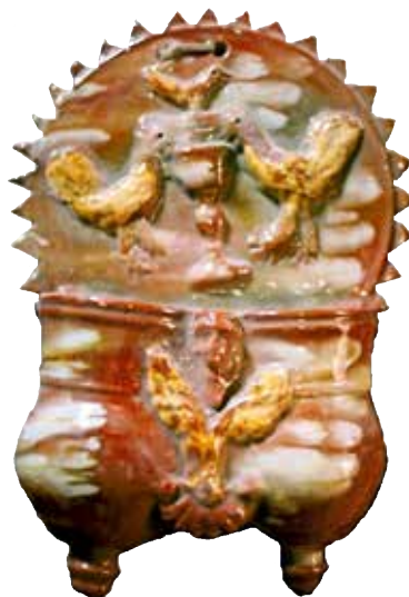
Figura 11. Cucharero número 6.

El frontis, acabado en picos, está compuesto por una escena, muy repetida en este alfar, de la pareja de aves bebiendo de un cáliz central. En el centro superior lleva una decoración compuesta por un pequeño pájaro. Los pocillos son dos recipientes cilíndricos y verticales unidos por los bordes, ligeramente abultados en la parte inferior, decorados por una máscara entre motivo vegetal y, debajo, una concha. El vedrío de la pieza es en tonos ocres y rojizos, con marcas estanníferas; resalta con engalba los pájaros y el motivo vegetal. Resulta una pieza elegante, bien construida.