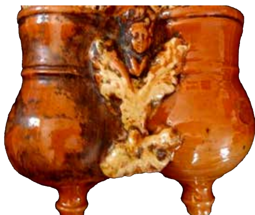
Figura 4. Detalle del cucharero 9.

se supone realizaron los Ybiricu, tal como hemos indicado en el epígrafe anterior. La parte inferior consta de uno o dos recipientes cilíndricos en donde se depositaban los cubiertos. Cuando son dos, la mayoría de las ocasiones, estos van unidos al frente por los bordes. Los recipientes acaban en un estrecho pitorro, hueco, que permitía la salida del agua. Esta parte inferior solía decorarse con círculos en relieve, figuras de angelotes, animales, etc. Destaca siempre el vedrío de las piezas, en colores y tonos muy variados, que a veces van entremezclados. Los rojos, verdes, pardos, estanníferos y amarillos son muy habituales. Este alarde de decoración y vedrío hace que estas piezas sean muy decorativas y atractivas a la vista, sin ninguna duda las piezas emblemáticas de la producción estellesa (fig. 5).