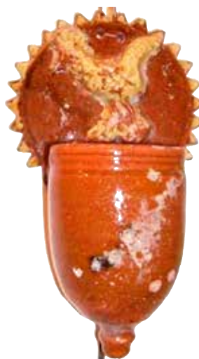
Figura 30. Cucharero número 25.

El frontis, acabado en picos, lleva en la parte central la composición de una solitaria ave. El pocillo consiste en un recipiente vertical que no lleva decoración alguna. El vidrio de la pieza está elaborado en tonos rojizos con engalga en el pájaro y los picos exteriores. Resulta una pieza mucho más simple que la mayoría de las catalogadas en este trabajo.