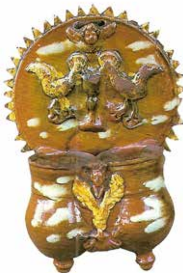
Figura 19. Cucharero número 14.

El frontis, acabado en picos, está compuesto por una escena, enormemente típica en este alfar, dos aves bebiendo de un cáliz central. En el centro superior lleva una decoración compuesta por un angelote de alas abiertas. Los pocillos son dos recipientes cilíndricos y verticales unidos por los bordes, ligeramente abultados en la parte inferior, decorados por una máscara entre motivo vegetal y motivo vegetal debajo de esto. El vidrio de la pieza es en tonos rojizos, y resalta con engalba los pájaros, el motivo vegetal y los picos exteriores. Lleva también toques estanníferos.