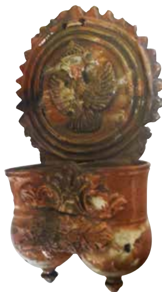
Figura 32. Cucharero número 26.

El frontis, que acaba en picos, se compone de una especie de círculos concéntricos. En el centro de los mismos lleva una decoración sencilla y compuesta por el águila bicéfala coronada. Los pocillos son dos recipientes cilíndricos y verticales unidos por los bordes, ligeramente abultados en la parte inferior, decorados por un gran motivo vegetal. El vedrío de la pieza es entre tonos rojizos, verdosos y blanquecinos. Resulta atractivo. Se trata también de una pieza muy interesante.