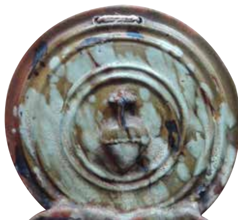
Figura 5. Detalle del cucharero 22.

El Museo Etnográfico de Navarra «Julio Caro Baroja» conserva una excelente colección de cuchareros, que se nos ha permitido estudiar para incluirlos en este artículo 6 . También pueden contemplarse varios cuchareros en el Museo Etnográfico del Reino de Navarra en Arteta, propiedad del conocido escultor José Ulibarrena. En la ciudad de Estella se conservan algunos ejemplares en casas y colecciones particulares. Y otros muchos se guardan en las mejores colecciones de alfarería, tanto en Navarra como en regiones limítrofes. En el artículo referente al alfar de los Ybiricu aportamos un catálogo con veinte cuchareros procedentes del mismo (Muruzábal, 2016, pp. 15-26). En el apartado posterior analizaremos, con sus correspondientes fotografías, ejemplares salidos del taller de los Echeverría.