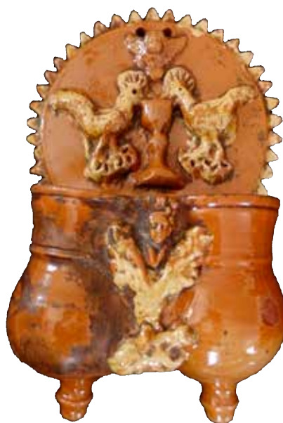
Figura 18. Cucharero número 13.

El frontis, acabado en picos, está compuesto por una escena, característica en este alfar, de los pájaros bebiendo de un cáliz central. En el centro superior lleva una decoración compuesta angelote de alas abiertas. Los pocillos son dos recipientes cilíndricos y verticales unidos por los bordes, ligeramente abultados en la parte inferior, decorados por una máscara entre motivo vegetal y un motivo vegetal debajo de esto. El vedrío de la pieza es en tonos rojizos, y resalta con engalba los pájaros, el motivo vegetal y los picos exteriores.